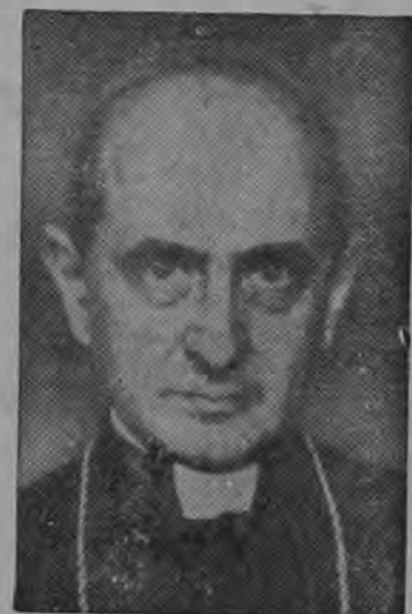
PAULO VI ...la Iglesia reitera su posición

El juicio y la actitud de los hombres libres y por encima de todos los católicos, ante el marxismo y el comunismo no pueden ni deben cambiar".