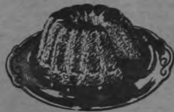
SUS QUEQUES CON MARGARINA