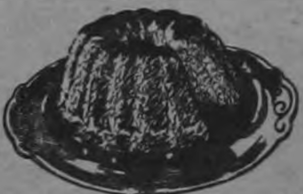
SUS QUEQUES CON MARGARINA